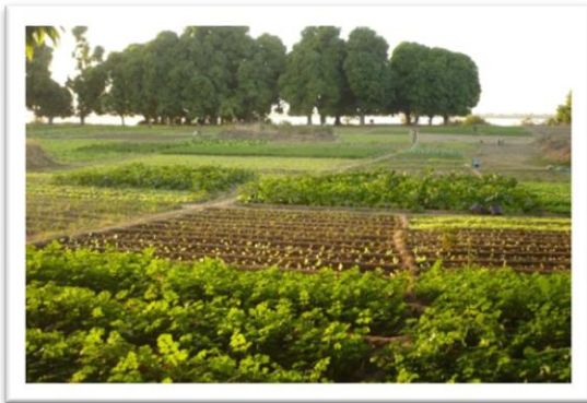
Gärten am Niger in Ségou

Da es im Moment angenehm kühl ist (mittags 30° C, nachts 12° C), kann viel